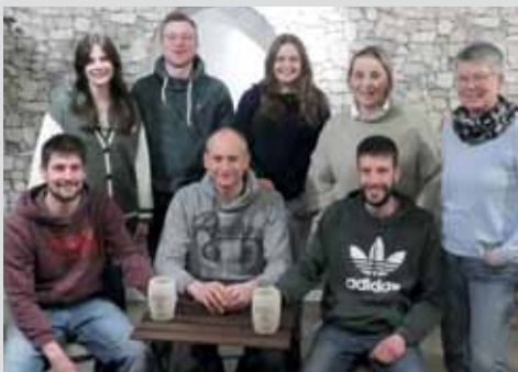
Theateraufführung 2024 des MTV Nordel Seite 2