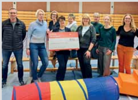
Spendenübergabe vom Erlös des Weihnachtsmarktes Seite 10