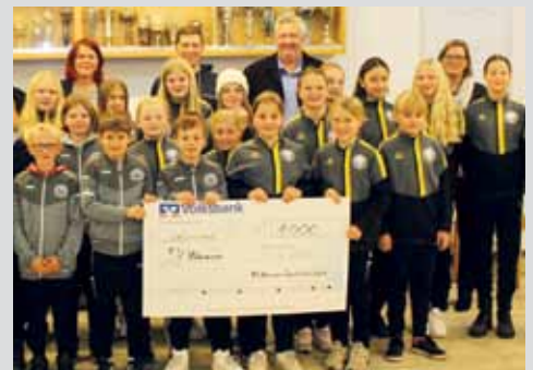
Großzügige Spende für den SV Warmsen Seite 11